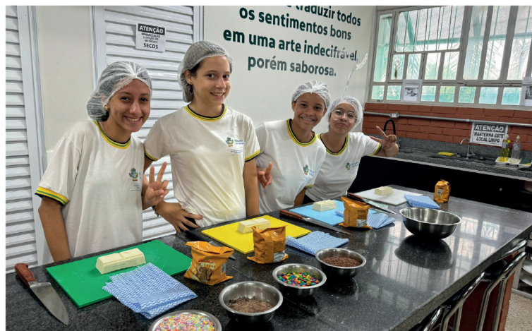
Cotec oferta cursos em áreas como gastronomia e informática

cializa o preparo para o mercado de trabalho é o Crédito Social. Focado no estímulo ao empreendedorismo, o programa transfere até R$ 5 mil ao beneficiário para aquisição de material de trabalho voltado ao próprio negócio, fruto do aprendizado adquirido nos cursos do Cotec. Já foram 18.717 pessoas atendidas desde 2021, o que representa mais de R$ 50,7 milhões aplicados pelo tesouro estadual.