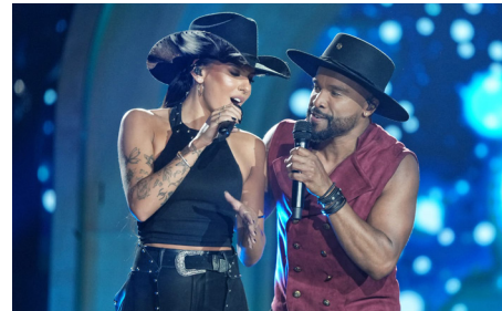
Na última quarta-feira (29), o cantor Alexandre Pires recebeu no palco do "Pagonejo Bão", no Espaço Dois Ipês, em Goiânia, a talentosa Ana Castela