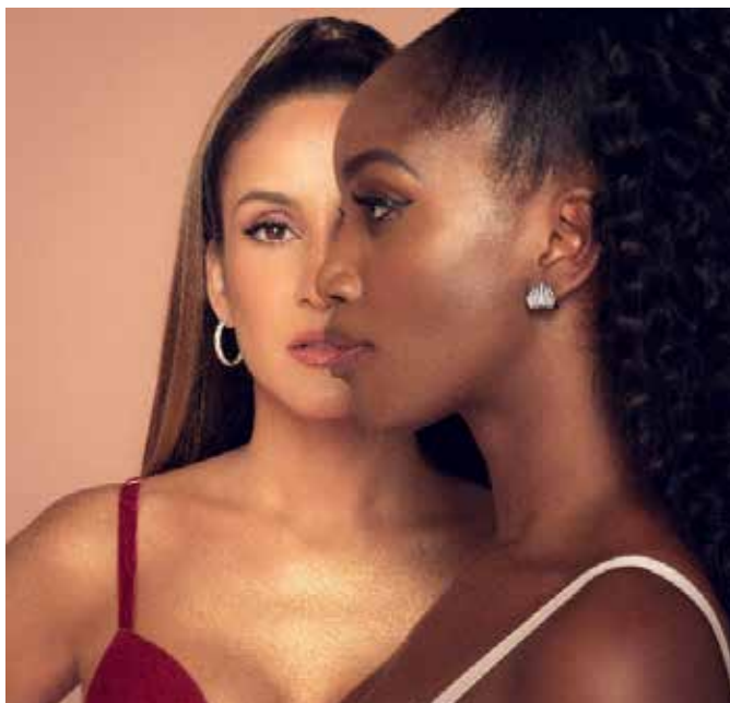
As cantoras Claudia Leitte e Iza são as estrelas da nova campanha da marca Plié