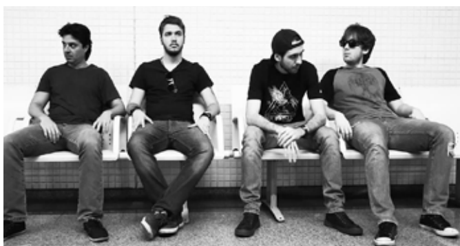
A banda Melodizy lança o EP War Machine com três músicas e pegadas diferentes

Estrelada por Gio Ewbank, Thaila Ayala e Caio Castro, a campanha de verão 2018 da Chill Beans deixou sua marca pelas praias brasileiras. Com mote 'Qual é a sua praia?', a grife trouxe imagens feitas em uma praia do litoral de São Paulo, com os atores ao lado de esculturas gigantes de areia. A campanha,