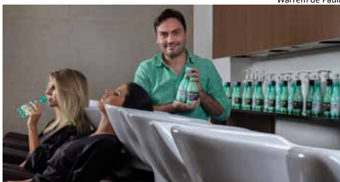
A RELOAD é a primeira marca de beauté a adotar embalagens PET reutilizadas